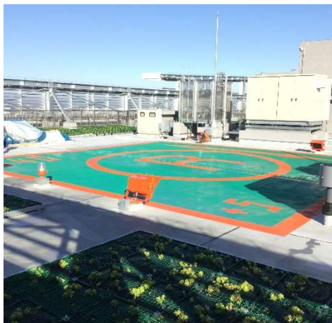
【写真②】E棟ヘリポート施工状況