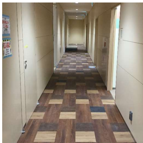
【写真①】E棟商業部廊下工事の様子