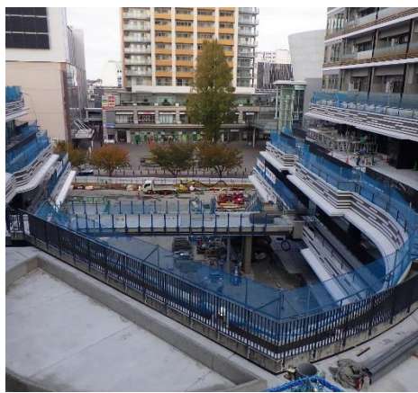
【写真② 広場横断橋の様子】