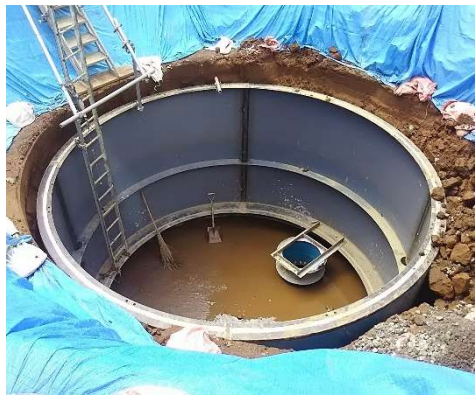
【写真② 防火水槽設置の様子】