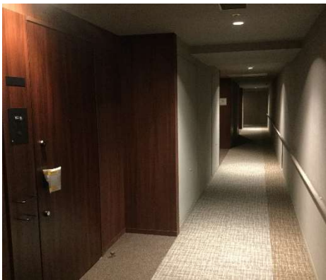
【写真① 内廊下の様子】