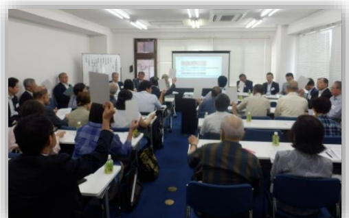
【令和元年度通常総会の様子】