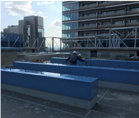
【写真③ 低層外装工事の様子】