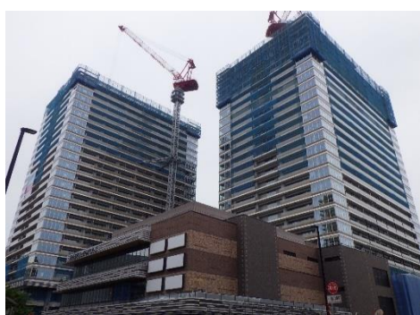
【写真①5月の現場の様子】