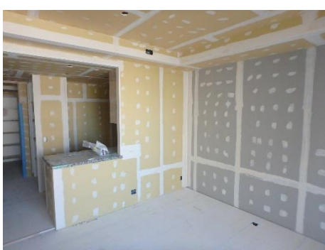
【写真②内装工事の様子】