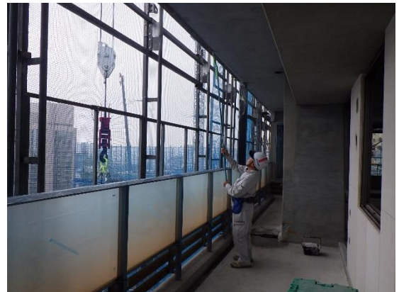
【写真①B棟7階バルコニーの様子】