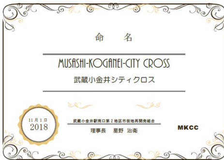
【武蔵小金井シティクロス命名書】

タウンネームの決定過程及び命名書を、 2018年11月1日（木）小金井市役所本庁舎にて 市長、副市長、市職員の方々にご報告しお渡し致しました。