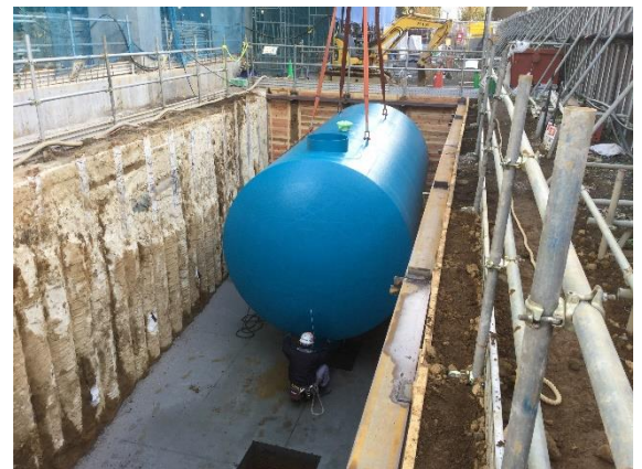
【写真②オイルタンクの様子】