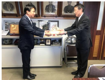
【市長への報告会の様子】