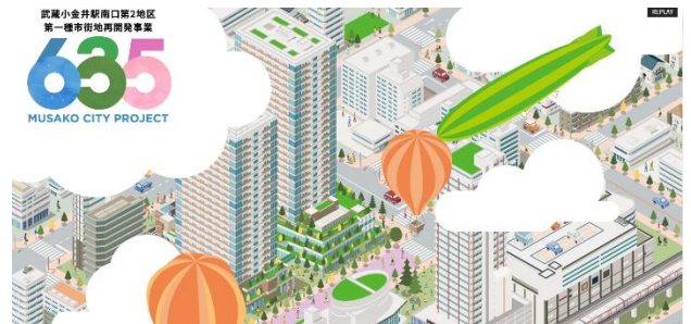
【ホームページのトップページ】

https://www.musashikoganei-saikaihatsu.jp/