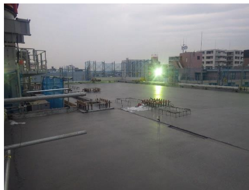
【写真①B棟8Fの床の様子】

皆さまには今後も騒音や交通規制等 ご迷惑をおかけすると思いますが、 引き続きご理解とご協力の程 よろしくお願い致します。