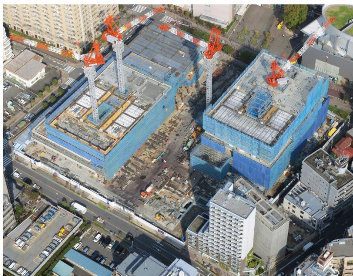
【写真③10月の工事状況】