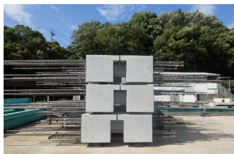
【本事業で使用する制振ダンパー梁】

建物を地震から守る制振ダンパー梁やバルコニーの部材など、実際に本事業で使用する部材の製造も既に始まっており、作り方を学ぶことができました。