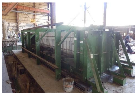
【本事業で使用するバルコニーの型枠】