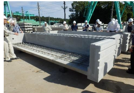
【養生中のバルコニー部材】