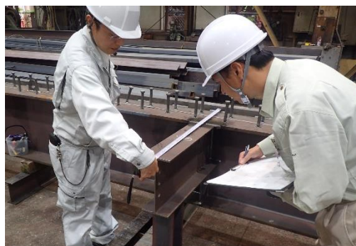
【写真③鉄骨の工場検査の様子】