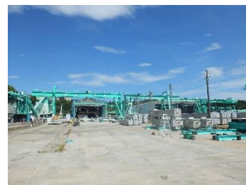
【SCプレコン千葉流山工場 の様子】

6月27日（水）に、本再開発事業で使用するプレキャストコンクリート*の製造工場の見学会を開催致しました。 （※現場ですぐに組み立て・取り付けができるよう、工場などで予め製造される鉄筋コンクリート部材のことです。）