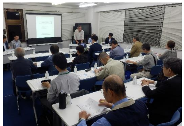
【管理運営検討会の様子】

次回は10月26日（木）夜を予定しております。 組合員の皆様には別途案内状を送付いたします。 皆様のご出席をお待ちしております！