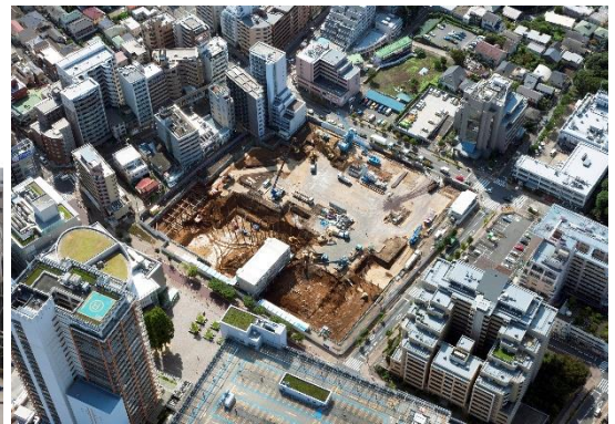
【新築工事の航空写真】